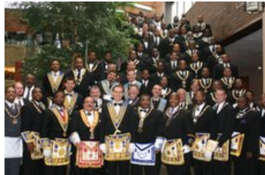
Participantes da Assembléia